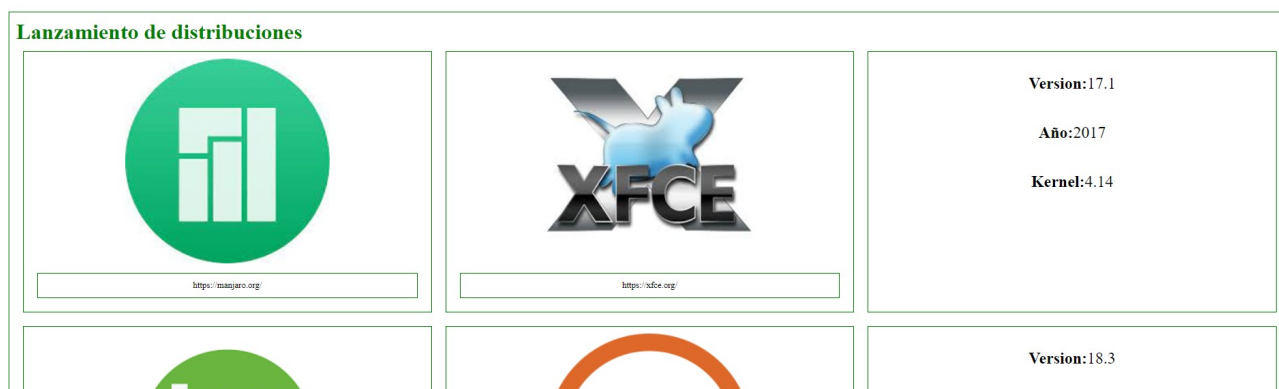
Figura 1: Lanzamiento de distribuciones (01.html) obtenida con XSLT